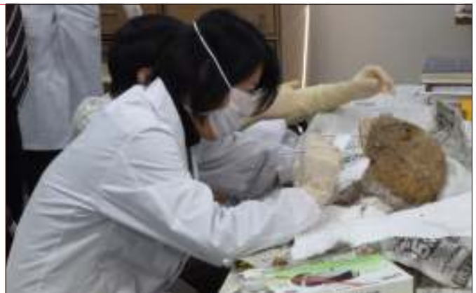
ストロンチウム同位体比分析の試料採取

Srは同じ元素でも2つの異なる質量を持っており、その数値を比であらわすと、地域ごとに異なる値が出ることが知られています。東日本の地質は若い火山岩を起源としているのに対し、西日本では火山の深い場所で生成された深成岩起源の地質なので、分析の結果が異なるのです。