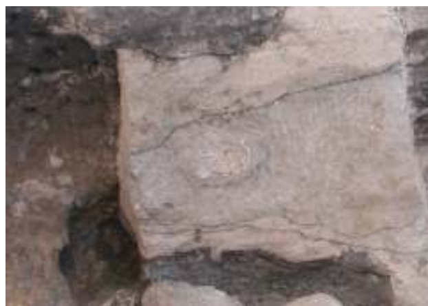
「乳児の古墳人」(2号人骨)