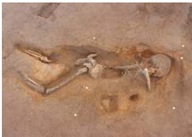
「首飾りの古墳人」(3号人骨)