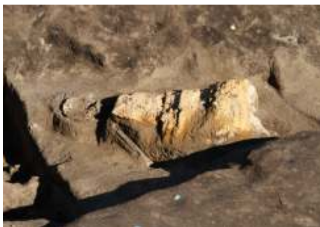
「甲を着た古墳人」(1号人骨)

いくつかおこなった分析の一つに、出身地を調べることができる方法があります。Sr(ストロンチウム)同位体比分析やCa/Sr(カルシウム/ストロンチウム)比分析という方法で、今回は古墳人たちの歯を用いておこないました。その結果、「甲を着た古墳人」(1号人骨)と「首飾りの古墳人」(3号人骨)は、群馬県より西の地域出身の可能性があり、その一方で「幼児の古墳人」(4号人骨)は群馬県内で生まれ育った可能性が高いことがわかりました。