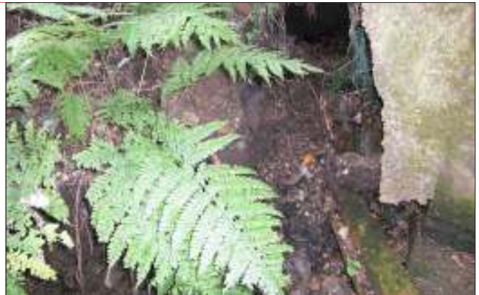
金井地域の水源「和尚沢」

岩石には地域特有の微量元素が含まれており、その一つにSr（ストロンチウム）があります。その土地の水や食べ物を摂取することにより、微量元素であるSrが骨や歯に取り込まれるので、古墳時代の人々の骨や歯を分析することで出身地が推定できるのです。