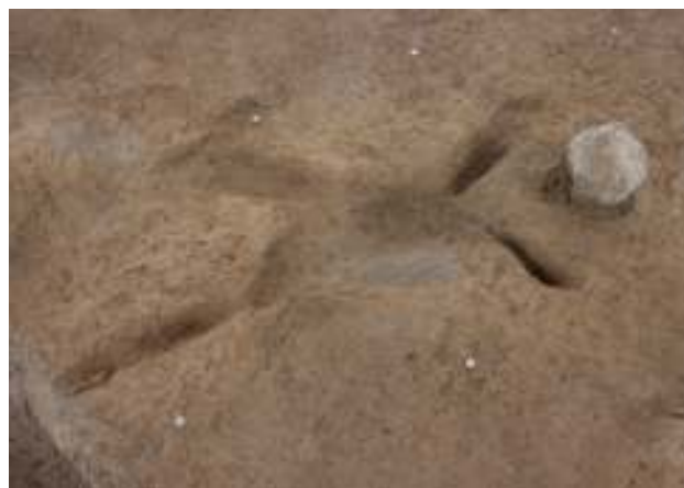
「幼児の古墳人」(4号人骨)