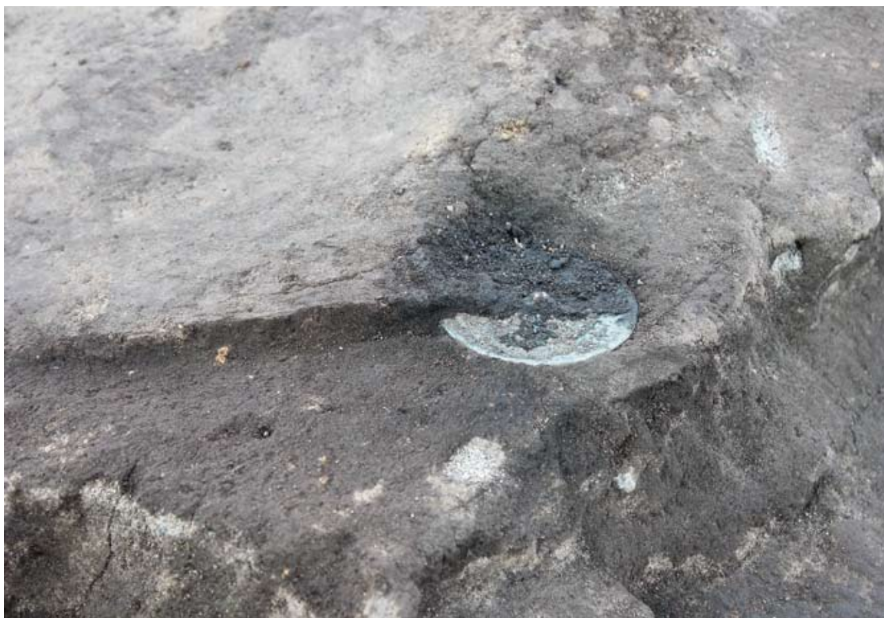
鏡の埋納（手前部分の黒色土を取り除いた状態）

出土した鏡は、日本国内で製作された鏡（倭製鏡）で、文様の特徴から「 ねじもん 振文鏡」の可能性が高いことが判明しました。鏡は、囲い状遺構の網代垣を設置した後に丁寧に埋納されており、囲い状遺構と強い関連があるものと考えられます。囲い状遺構の性格を考える上で、また、古墳時代の鏡の役割を考える上で貴重な発見となりました。