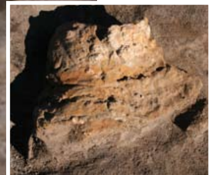
発見された時の2号甲