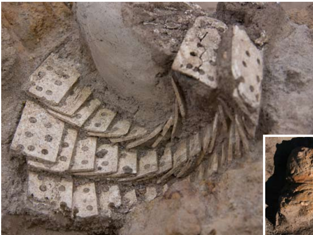
2号甲内部から発見された骨製小札

骨製小札は、非常にもろいため、公開できる状態ではありませんが、今後はこの骨製小札がどのように用いられたのか、素材となった骨の動物種や使用部位などについて調査を進めていく予定です。