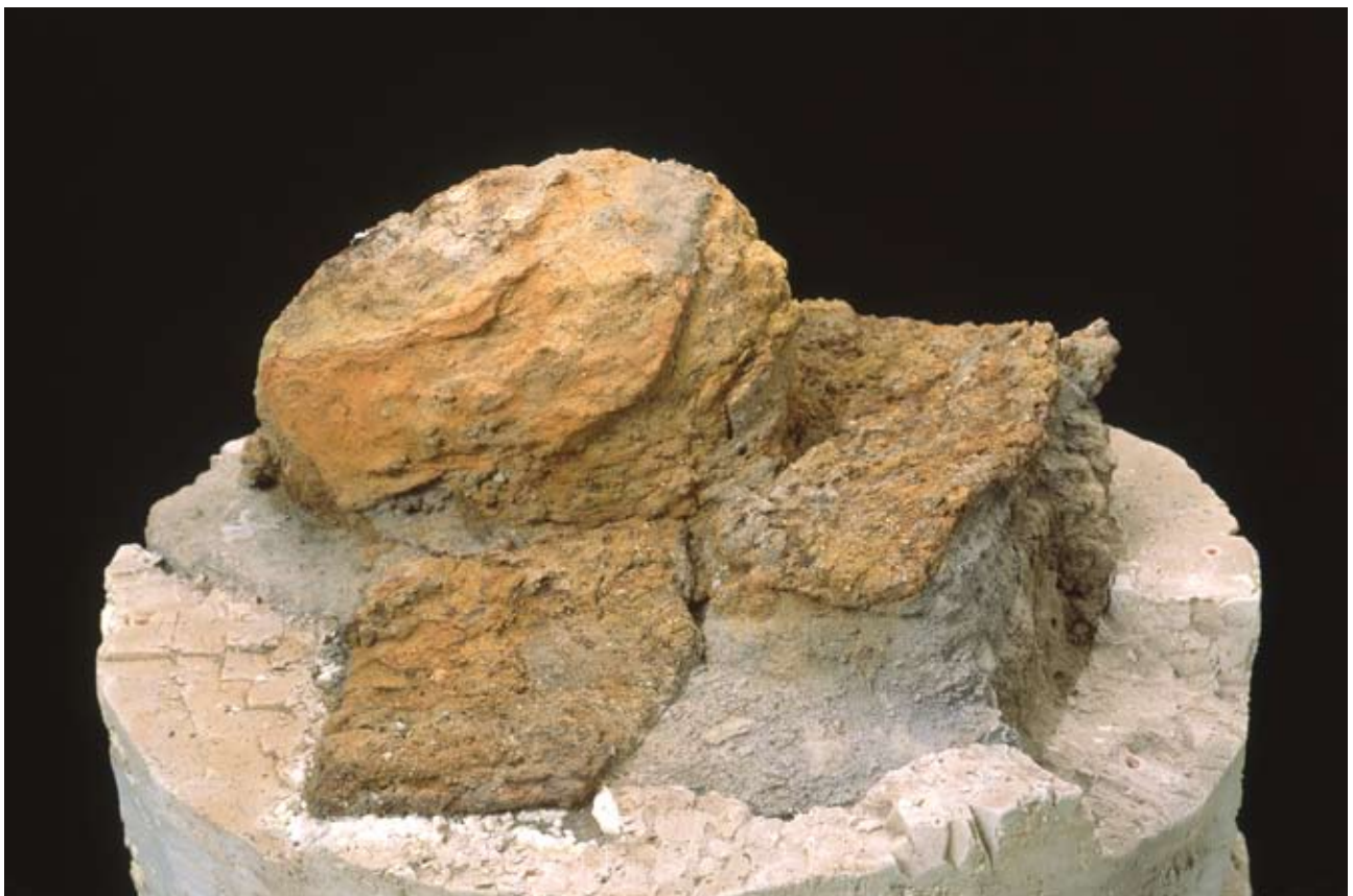
火砕流堆積物を取り除いた状態の衝角付冑

冑は再び当事業団に搬送され、周囲の火砕流堆積物が取り除かれました。外面は全体がサビで覆われていましたが、小札をつなぎ合わせて作られた頬当、鋳もその姿を現わしました。