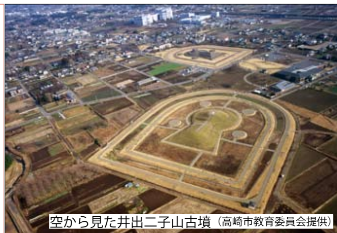
空から見た井出二子山古墳

「甲を着た古墳人」が持っていた衝角付胄は、高崎市にある墳丘長 108 m の前方後円墳、井出二子山古墳から発見された胄と同じ形をしています。頬当や鍔が小札をつなぎ合わせて作られていることも同じです。「甲を着た古墳人」も前方後円墳やそれに準じる有力古墳を造るような階層の人だったのかもしれませんが。