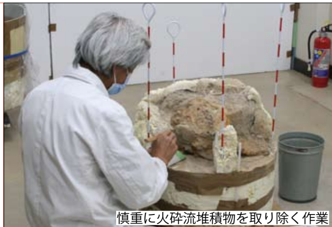
慎重に火砕流堆積物を取り除く作業

ヘラや筆を使って少しずつ火砕流堆積物を取り除いていくと、鉄の板で形づくられた胄の鉢の部分や、頬当や鍔の小札が並ぶ様子、紐や繊維の付着していた痕跡などがサビとなって見つかりました。CTスキャンの画像そのままの衝角付胄が姿をあらわしました。