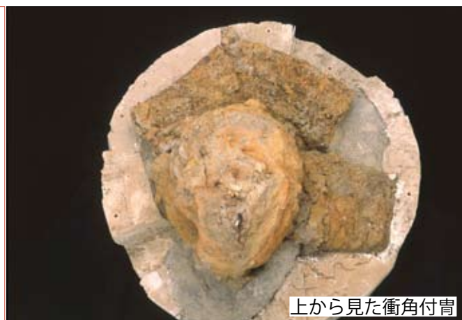
上から見た衝角付胄

衝角付胄は、正面が軍艦の舳先（衝角）に似て、尖った形をしているところから名づけられたものです。古墳時代中期から飛鳥時代以降まで、形を変えながら作り続けられました。小札の頬当や鍔は、古墳時代後期以降、衝角付胄の付属具として普及していきました。